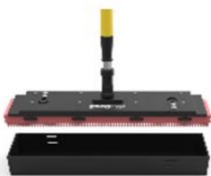
Tread-TEQ tool 60 cm (24 inch)