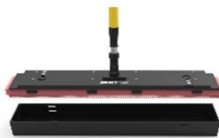
Tread-TEQ tool 80 cm (32 inch)