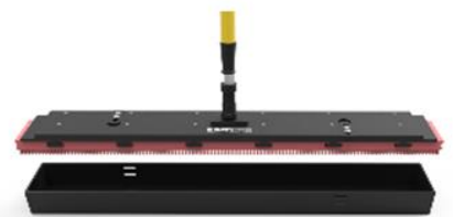
Tread-TEQ tool 100 cm (40 inch)