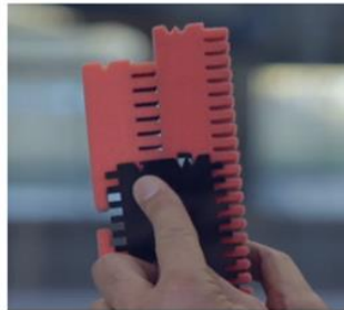
Left V and right W pattern.

This is the Fit Tool. On top you see the V-pattern, at the bottom the W-pattern.