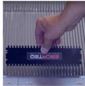
Fit Tool on escalator tread. The V-side fits so this escalator has a V-pattern.