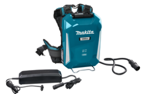
NLBPDC1200A02 Ruggedragen Accu PDC1200 Incl.