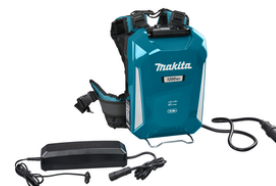
NLBPDC1200A02 Ruggedragen Accu PDC1200 Incl.