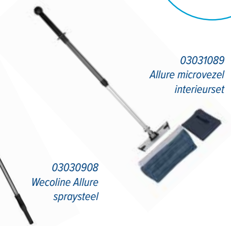
03031089 Allure microvezel interieurset

Eenvoudig aan de slag met de Allure microvezel sets