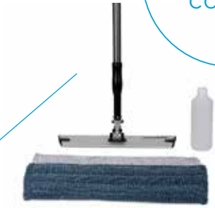
03031079 Allure microvezel vloerset

Om je optimaal te kunnen bedienen denken wij in concepten. Voor de ontwikkeling van deze nieuwe concepten staan wij in nauw contact met distributeurs en eindgebruikers. Als voorbeeld laten we hier één van onze concepten zien: het Allure microvezel concept.