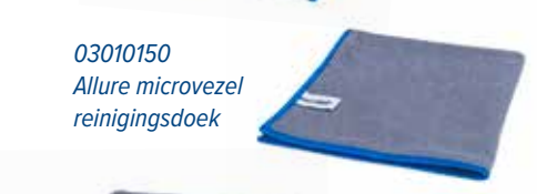
03010150 Allure microvezel reinigingsdoek