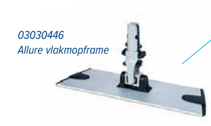
03030446 Allure vlakmopframe