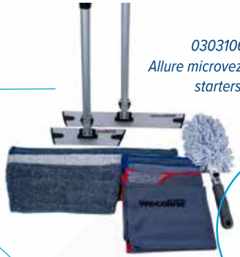
03031069 Allure microvezel starterset

Eenvoudig aan de slag met de Allure microvezel sets