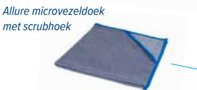
03010140 Allure microvezeldoek met scrubhoek