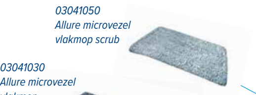
03041050 Allure microvezel vlakmap scrub