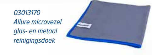
03013170 Allure microvezel glas- en metaal reinigingsdoek