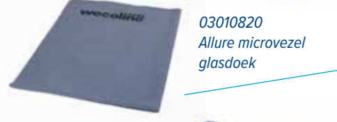
03010820 Allure microvezel glasdoek