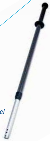
03030706 Allure telescoopsteel ergonomisch

Om je optimaal te kunnen bedienen denken wij in concepten. Voor de ontwikkeling van deze nieuwe concepten staan wij in nauw contact met distributeurs en eindgebruikers. Als voorbeeld laten we hier één van onze concepten zien: het Allure microvezel concept.